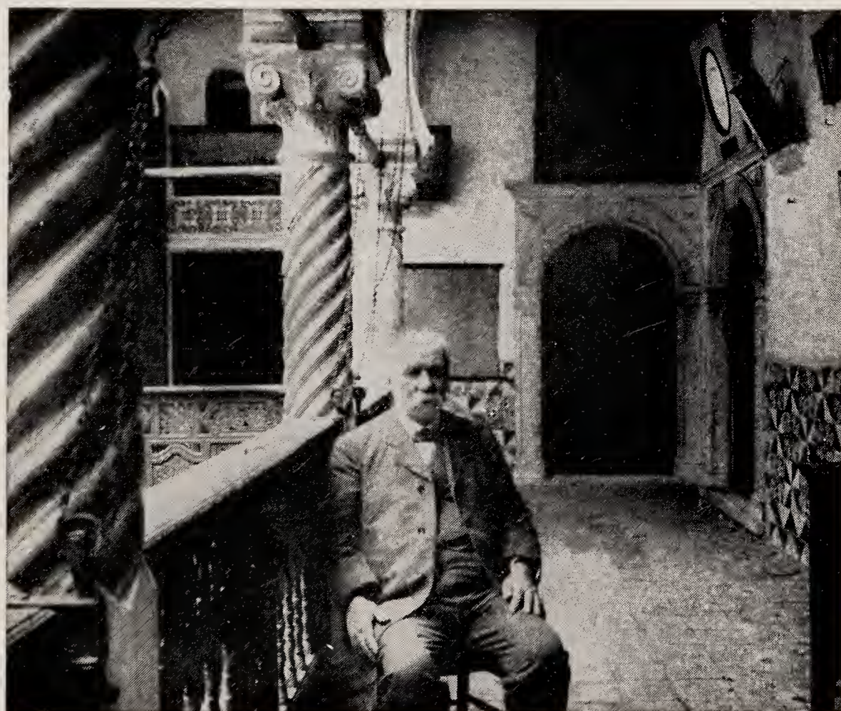
Emile MAUPAS à la Bibliothèque nationale d'Alger.